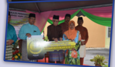
2. Penyampaian Bantuan Persekolahan, Bulanan, Bina dan Baik Pulih Rumah serta Perasmian Penutup Kembara MAIPk 2014 oleh Orang Besar Jajahan Perak Tengah