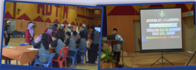
1. Program Eksekutif Talk Zakat bersama-sama dengan pekhidmat sektor awam Daerah Slim River.