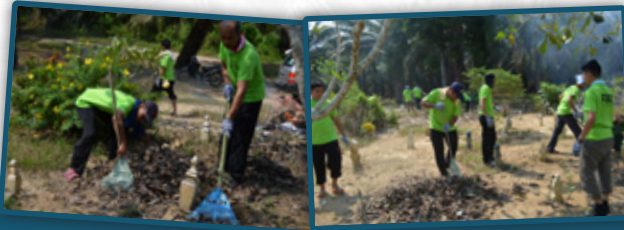
3. Program Gotong Royong Masjid dan Kubur bersama-sama dengan Kariah Masjid Jamek Batak Rabit