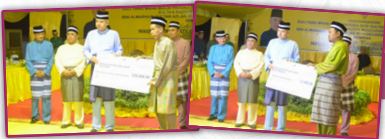
◆ DAERAH KINTA