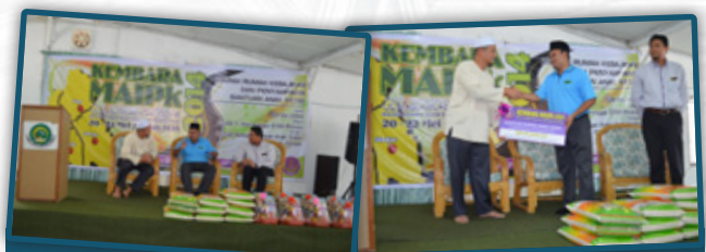
2. Ziarah Anak-Anak Yatim di Rumah Kebajikan Anak-Anak Yatim Darul Aitam, Temoh untuk pemberian Bantuan Pembangunan Islam.