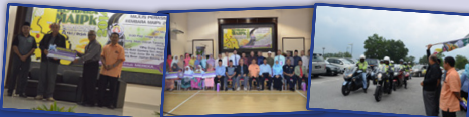
3. Penerima-penerima Bantuan Bina Rumah, Baik Pulih Rumah dan Persekolahan Daerah Batang Padang bergambar dengan OBJ Batang Padang.