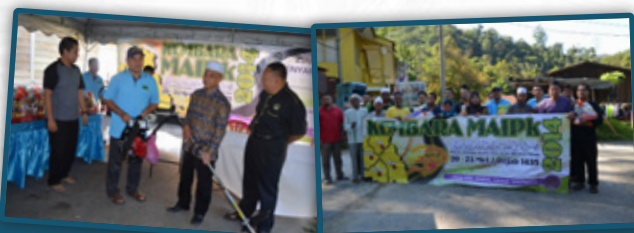
1. Penyampaian Bantuan Bina Rumah Muallaf dan Bantuan Peralatan di Kampung Orang Asli Batu 14, Jalan Pahang, Tapah.