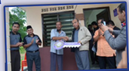
4. Ziarah Penerima Bantuan Bina Rumah di Kg. Kuala Slim.