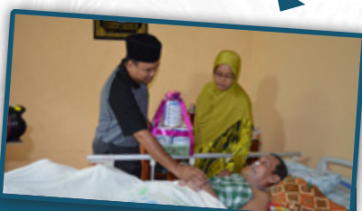
3. Ziarah Penerima Bantuan Perubatan di Trolak Selatan.