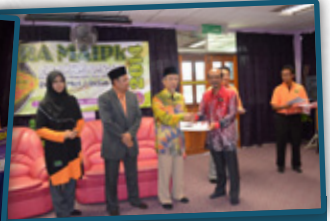
2. Penyampaian Bantuan Persekolahan, Pembangunan Islam dan Sijil Penghargaan Wakaf Daerah Teluk Intan